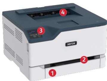
Xerox® C230 színes nyomtató