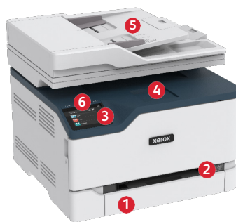
Xerox® C235 színes, többfunkciós nyomtató